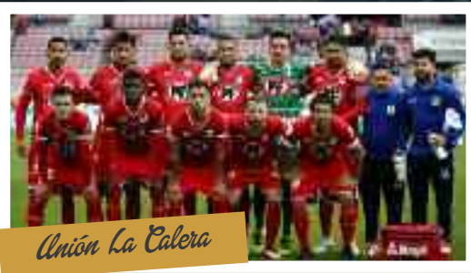
Unión La Calera