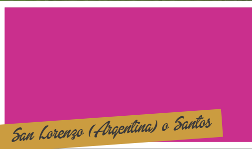
San Lorenzo (Argentina) o Santos