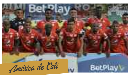
América de Cali