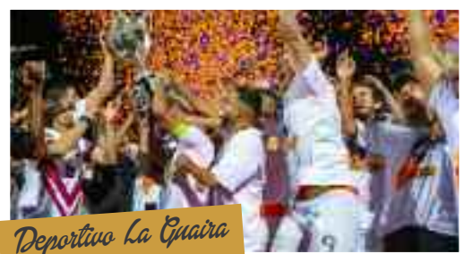
Deportivo La Guaira