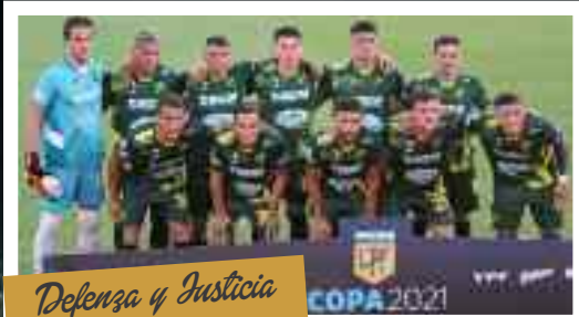
Defensa y Justicia