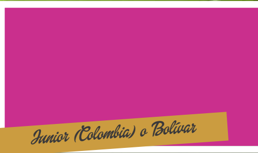
Junior (Colombia) o Bolívar