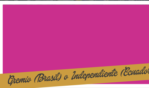
Gremio (Brasil) o Independiente (Ecuador)