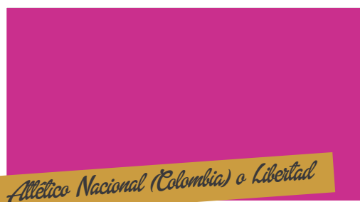
Atlético Nacional (Colombia) o Libertad