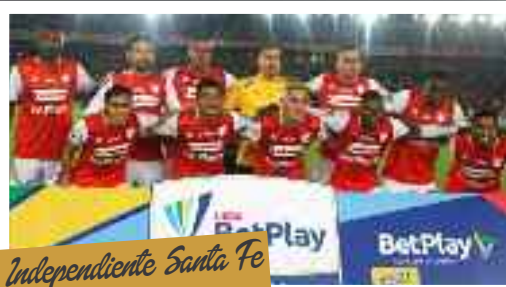
Independiente Santa Fe