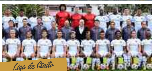
Liga de Quito